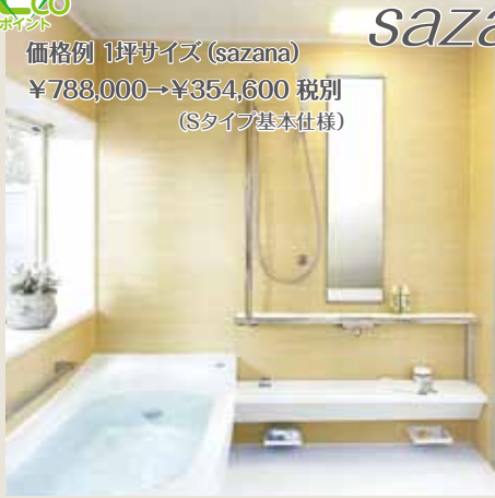
※写真は1616タイプです。

価格例 1坪サイズ (sazana) ¥788,000→¥354,600 税別 (Sタイプ基本仕様)