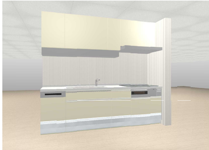
※画像はイメージです。表示されている色は実物とは異なります。